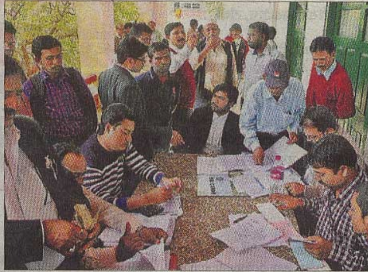
लोक अदालत को लेकर लोगों में था उत्साह.

रांची : सिविल कोर्ट में लगे राष्ट्रीय लोक अदालत में 15 हजार से अधिक मामले निपटारे गये. समझौते के तहत दस करोड़ से अधिक रुपये विभिन्न पार्टियों के बीच प्रदान किये गये. विभिन्न बैंकों के बकाये ऋण की वसूली, भूमि अधिग्रहण, वाहन दुर्घटना का दावा, बिजली विभाग से संबंधित, वन विभाग, राजस्व, बैंक सर्टिफिकेट केस, श्रम, वैवाहिक/पारिवारिक, आपराधिक मामले निपटारे गये. वादों के निष्पादन के लिए 33 बेंच का गठन किया गया था. सिविल कोर्ट में पहुंचे 1077 मामलों से 1,12,06,622 रुपये का सेटलमेंट कराया गया. लेबर कोर्ट में दायर आठ मामलों से 7,15,470 रुपये, सेंट्रल लेबर डिपार्टमेंट में 42,55,179 रुपये सेटलमेंट कराये गये. एमएसीटी क्लेम (मोटर वाहन दुर्घटना) से संबंधित 43, 50,000 रुपये का भुगतान किया गया. इससे पूर्व सुबह नौ बजे ई-कोर्ट रूम में वीडियो कांफ्रेंसिंग के जरिये राष्ट्रीय लोक अदालत का उद्घाटन हुआ. इधर, ऋण वसूली अधिकरण के तत्वावधान में बैंकों से संबंधित मामले निबटारे गये. इसमें बैंकों के उन मामलों को लिया गया, जो अधिकरण में लंबित हैं. आपसी सहमति से 38 मामलों का निबटारा किया.