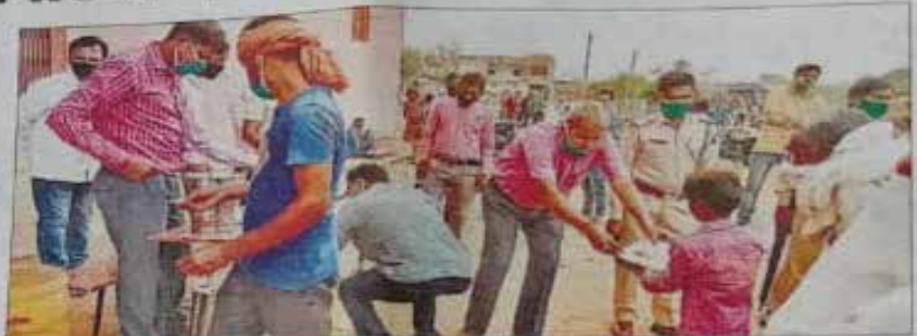
भोजन कराते न्यायिक पदाधिकारी ।