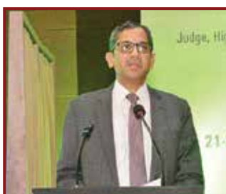
Hon'ble Mr. Justice N.V. Ramana, Judge, Supreme Court of India & Executive Chairman, NALSA addressing the participants.