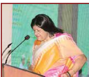
Hon'ble Ms. Justice Indira Banerjee, Judge, Supreme Court of India & Member, Supreme Court Committee for Sensitization of Family Court Matters addressing the participants.