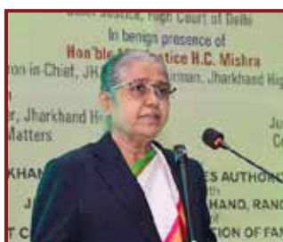
Hon'ble Mrs. Justice R. Banumathi, Judge, Supreme Court of India & Chairperson, Supreme Court Committee for Sensitization of Family Court Matters addressing the participants.