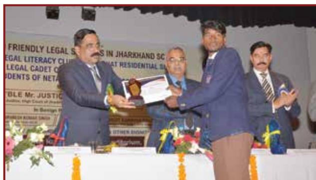
Hon'ble Mr. Justice Sujit Narayan Prasad, Judge, High Court of Jharkhand felicitating the Students of Netarhat Residential School