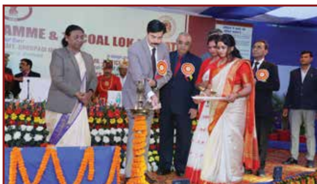
Hon'ble Mr. Justice Dr. Ravi Ranjan, Chief Justice, High Court of Jharkhand cum Patron-in-Chief, JHALSA inaugurating the programme by lighting of lamp.