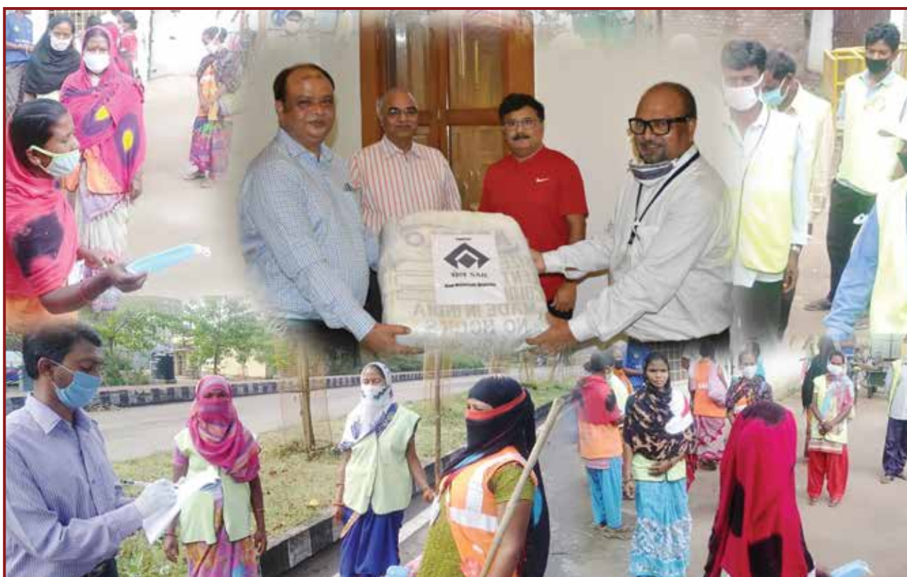
2000 masks given by SAIL to JHALSA being distributed amongst Safai Karmacharis in Ranchi.