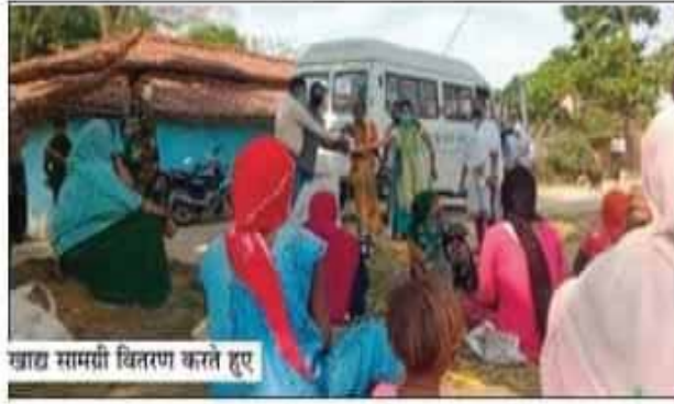
खाद्य सामग्री वितरण करते हुए

चतरा/खलारी। विश्वव्यापी महामारी कोरोना वायरस संक्रमण से बचाव के लिए लॉकडाउन के चलते असहाय व निर्धन वर्ग की सहायता के लिए शहर के विभिन्न स्वयंसेवी सामाजिक व धार्मिक संगठन निरन्तर सक्रिय है। वहीं जिला विधिक सेवा प्राधिकार, रांची के सचिव के निर्देशानुसार जरूरतमंदों के बीच डालसा के सेवा रथ चान्दो थाना क्षेत्र के बिजुपाड़ा, टांगर, करकट एवं चोड़ा ग्राम में जरूरतमंदों के