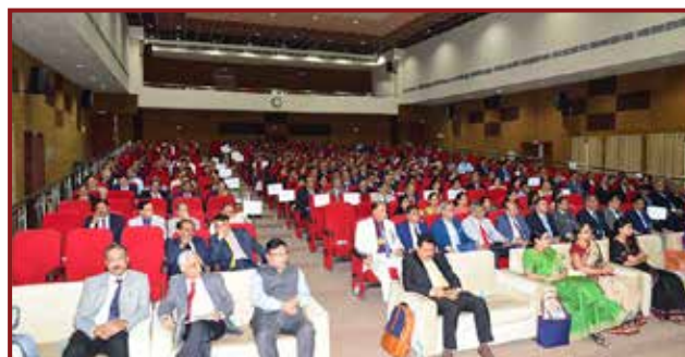
Hon'ble Judges of High Courts of India, Judicial Officers & Participants attending the Programmes