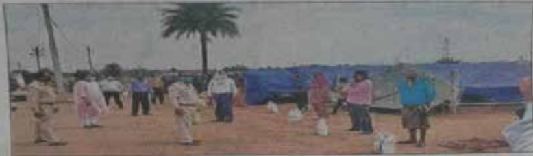
बुधवार को खाद्यान्न का वितरण करते न्यायिक पदाधिकारी ।