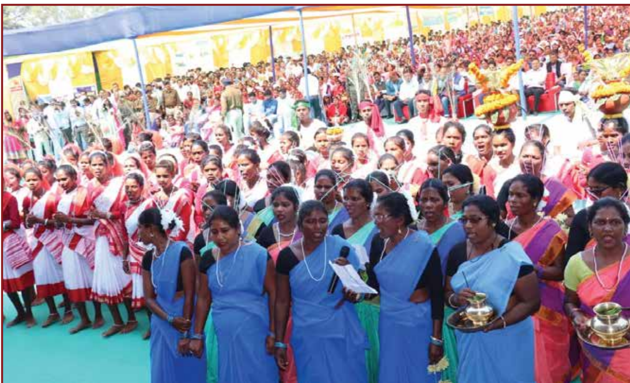
Large gathering at Empowerment Camp, Albert Ekka Stadium, Simdega.