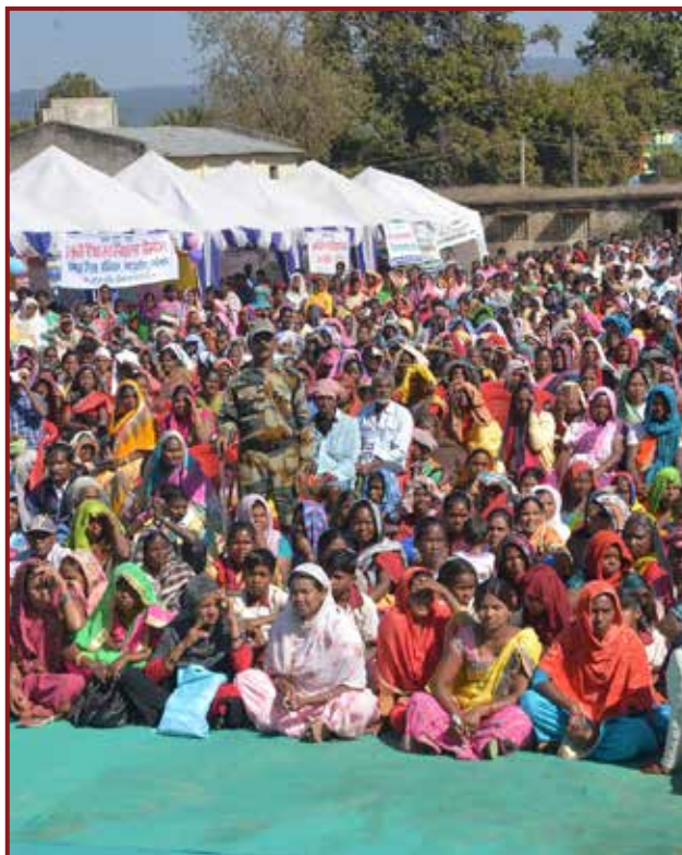
Large gathering at Empowerment Camp, SDO Office Compound, Mahuadanr, Latehar