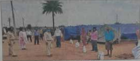
पुष्पार को खाद्यान्न का वितरण करते न्यायिक पदाधिकारी ।