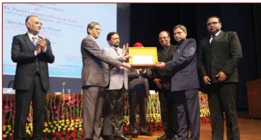
Hon'ble Mr. Justice N.V. Ramana, Judge, Supreme Court of India & Executive Chairman, NALSA felicitating DLSA Gumla, Jharkhand as the NATIONAL BEST DLSA at Supreme Court Auditorium, New Delhi on 9th November, 2019.