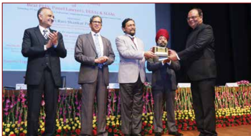
Hon'ble Mr. Justice S.A. Bobde, Chief Justice of India cum Patron-in-Chief, NALSA felicitating JHALSA as BEST SLSA IN EAST ZONE at Supreme Court Auditorium, New Delhi on 9th November, 2019.