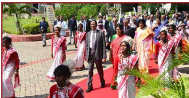
Traditional Welcome of Hon'ble Chief Guests, Dignitaries & Guests