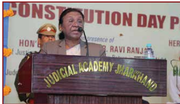
Her Excellency Smt. Droupadi Murmu, Hon'ble Governor, Jharkhand addressing the participants at the Programme